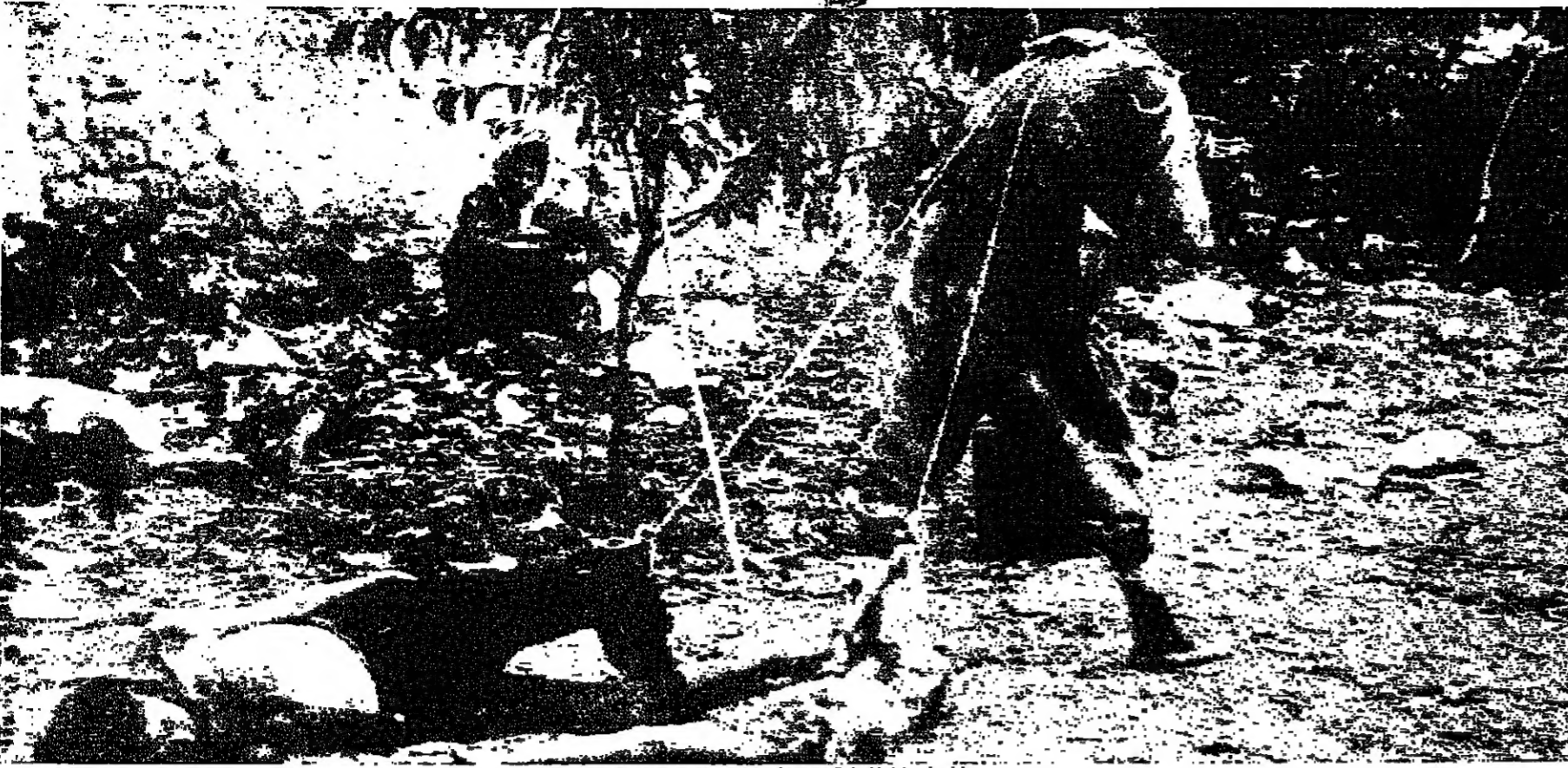
جثث ضحايا المجاعة ... هكذا كانت تنقل من الطرقات

واصيب اللبنانيون بالفقر من الضرائب المرتفعة التي كانت الحكومة التركية وضعتها، وعندما هبت علة الوبق التركي في شهور شباط ١٩١٧ بشكل ملحوظ، ازداد ارتفاع ثمن البضائع والغذاء الى درجة فاحشة، وبقي يزداد ويزداد.